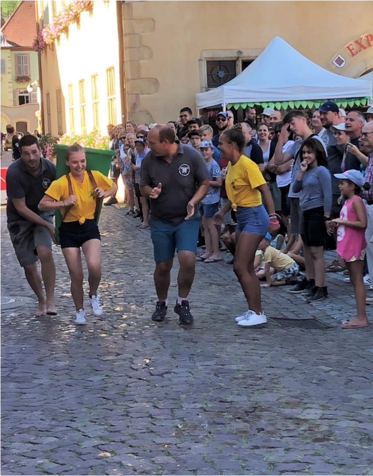
Ambiance bien sympathique 😊