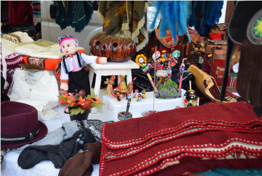
Les superbes décorations sur le thème de la citrouille