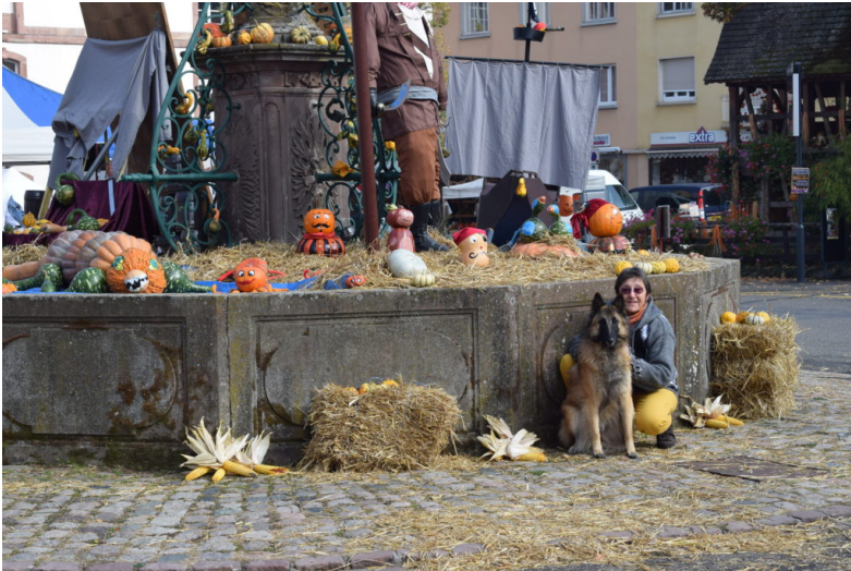
Notre stand sur la place principale ..