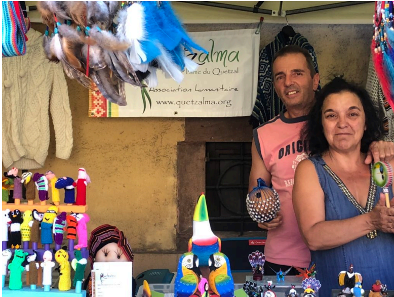
Hostellerie aux Deux Clefs ...